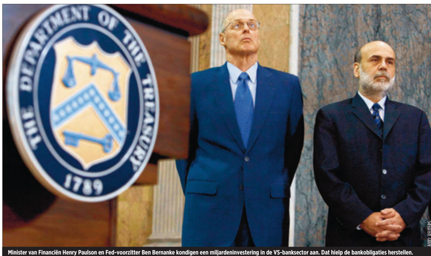
Minister van Financiën Henry Paulson en Fed-voorzitter Ben Bernanke kondigen een miljardeninvestering in de VS-banksector aan. Dat hielp de bankobligaties herstellen.